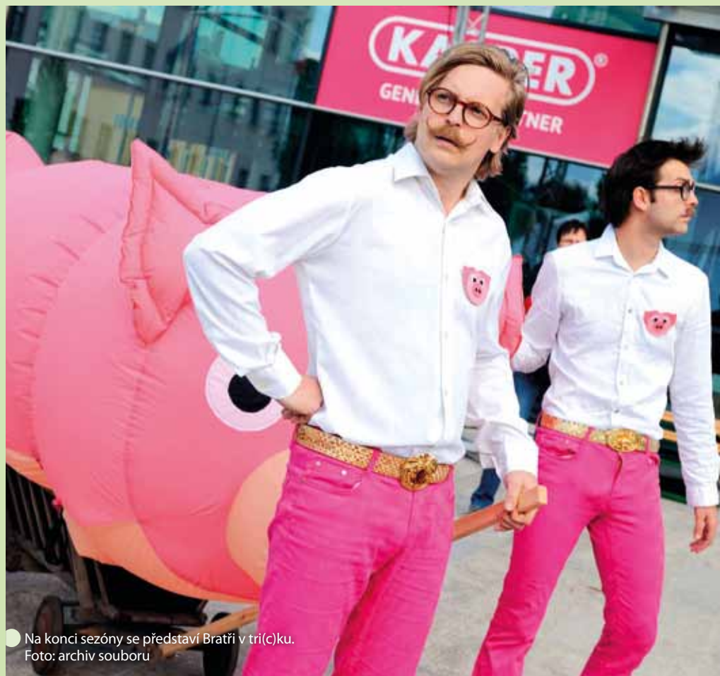
● Na konci sezóny se představí Bratři v tři(c)ku.

Aby se v nejbližší době podařilo loutkové divadlo opravit tak, aby se v něm všem souborům dobře hrálo a aby do něj diváci stále rádi chodili.