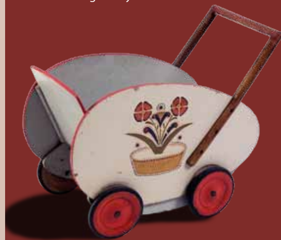
Sportovní kočárek pro panenky, 30.–40. léta 20. století, sbírky Slezského zemského muzea