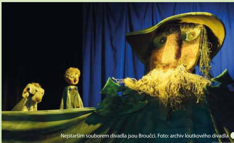
Nejstarším souborem divadla jsou Broučci.

Loutkářský soubor Broučci (vedoucí Leo Hein): nejdéle pracující soubor tíhne spíše ke klasice a hry většinou inscenuje se za-