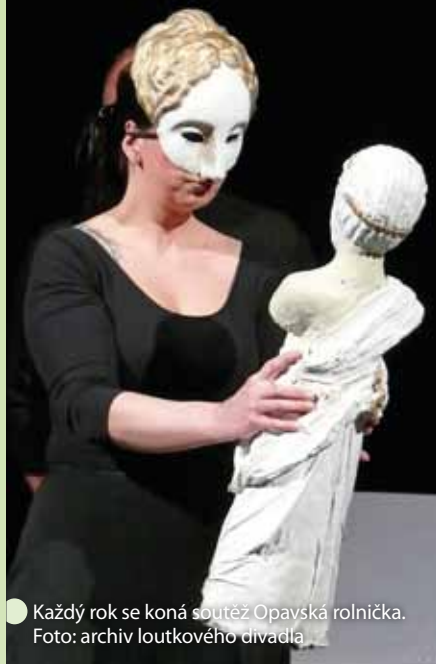
● Každý rok se koná soutěž Opavská rolníčka.

krytým voděním a rozdělenou interpretací vodičů a mluvičů.