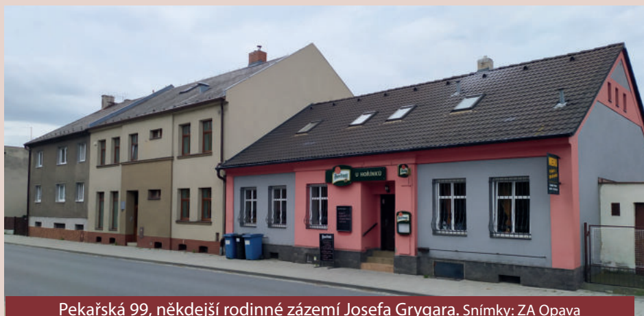
Pekařská 99, někdejší rodinné zázemí Josefa Grygara.