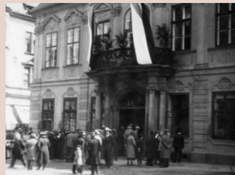
Slavnostní otevření nové expozice zemědělského muzea roku 1932 v budově Blücherova paláce na Masarykově třídě.

s odbornými časopisy a další specializovanou literaturou. Po nacistickém záboru Sudet byla expozice pobočky zrušena a sbírky včleněny do kolekce nově ustaveného Říšského župního muzea. Provizorní evakuaci v závěru války pak přečkal jen jejich zlomek. Ten však dodnes v rámci současné sbírky Slezského zemského muzea podává svědectví o obraze venkova, který v druhé polovině minulého století prošel skutečně dramatickou proměnou, a o významu, který mu protagonisté meziválečného intelektuálního a politického života přisuzovali.