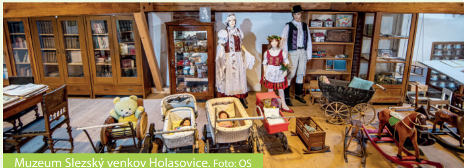
Muzeum Slezský venkov Holasovice.

Další zastavení v blízkosti, spojené s těž-