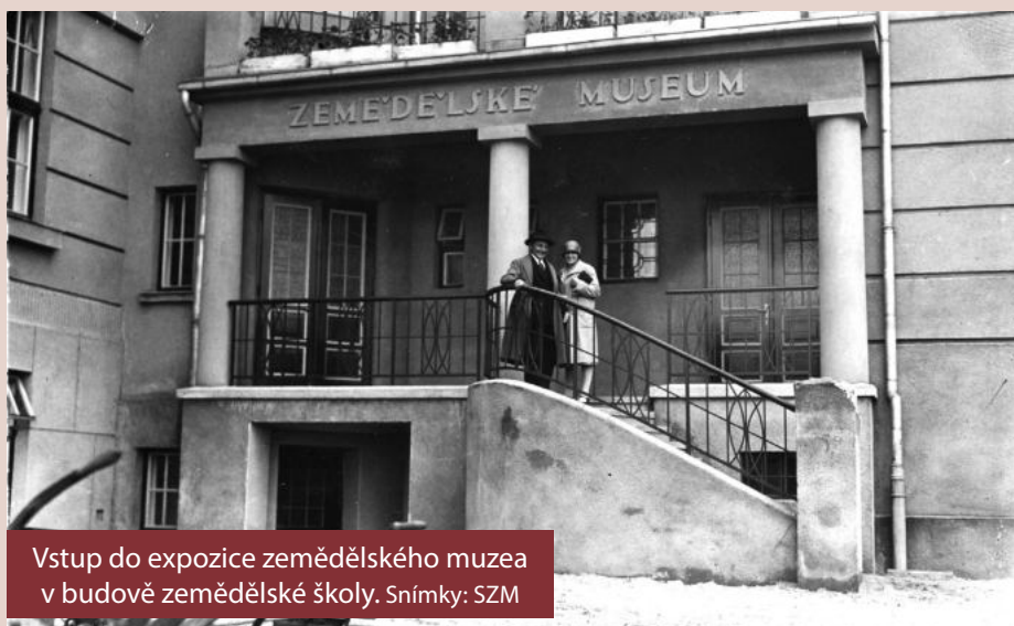
Vstup do expozice zemědělského muzea v budově zemědělské školy.