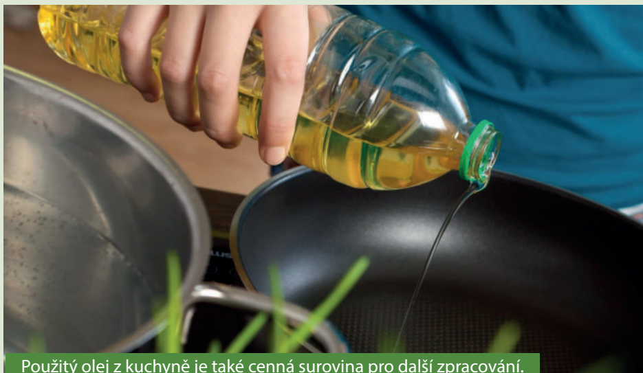
Použitý olej z kuchyně je také cenná surovina pro další zpracování.

Špinavý použitý olej musí nejprve projít mechanickým čištěním, aby se zbavil zbylých jemných kousků plastů, pevných zbytků jídla, jako je třeba strouhanka, kousky masa