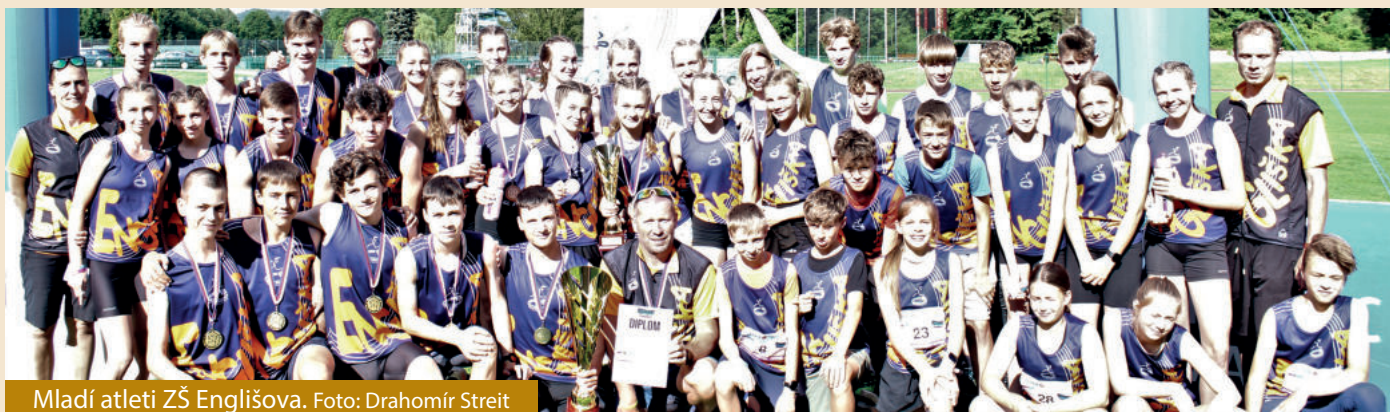
Mladí atleti ZŠ Englišova.

Jednu zlatou, jednu bronzovou medaili a další dvě umístění v Top 6 vybojovali na Mistrovství České republiky základních škol v atletice mladí sportovci ZŠ Englišova v Opavě. Na atletickém stadionu v Trutnově se uskutečnil už 53. ročník Poháru rozhlasu a opavská škola jako jediná měla na startu všechny čtyři mládežnická družstva. Engliška suverénně ovládla okresní a krajská kola a díky skvělým výsledkům prošla přísným kvalifikačním sítem.