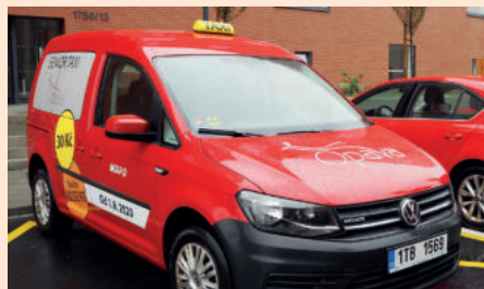
Senior taxi sveze k lékaři nebo na úřad za 30 Kč.

S lužba opavského Senior taxi, kterou pro město Opavu zajišťuje Městský dopravní podnik Opava (MDPO), asi představovat nemusíme. Ale přesto – jedná se o cenově výhodnou autodopravu po Opavě, určenou především seniorům na cesty k lékaři, na úřady a vůbec všude tam, kam by měli potíže díky svému zdraví či věku cestovat. Služba je od počátku určena pro občany s trvalým bydlištěm v Opavě a od loňského září zajíždí i do všech městských částí. Cesta po Opavě je zpoplatněna třiceti korunami, pro cesty z městských částí je pak cena 50 Kč, stejnou taxu zaplatí i osoba, která objednavatele doprovází. Doprovod držitele průkazu ZTP/P má jízdu zdarma. Cestovné lze uhradit v hotovosti nebo bankovní kartou.