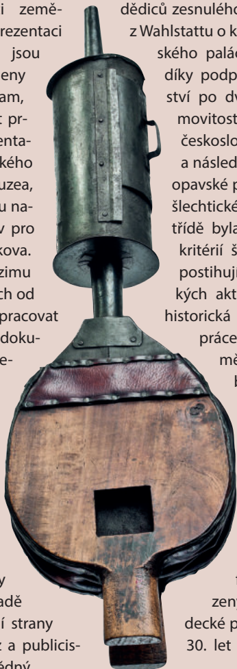
Včelařský kuřák z poloviny 19. století

dědiců zesnulého hraběte Lothara Blüchera z Wahlstattu o koupi jeho opavského městského paláce. Pražské ústředí muzea díky podpoře ministerstva zemědělství po dvouletém vyjednávání nemovitost za nemalou cenu 550 tisíc československých korun zakoupilo a následně adaptovalo pro potřeby opavské pobočky. V patře barokního šlechtického paláce na Masarykově třídě byla vytvořena dle dobových kritérií špičková muzejní expozice postihující široké spektrum rolnických aktivit, členěných do oddílů: historická retrospektiva zemědělské práce, lesnictví a současné zemědělství. Součástí expozice bylo také impresivní dioráma představující výhled z okna na slezskou krajinu u Opavy během žní. Spolu s lovem a myslivostí bylo předmětem zájmu muzejníků například i včelařství. Do pestrého sbírkového fondu byly později přiřazeny také sbírky zrušené frýdecké pobočky. Ve druhé polovině 30. let sbírka čítala více než šest tisíc exemplářů a kromě toho muzeum spravovalo rovněž knihovnu