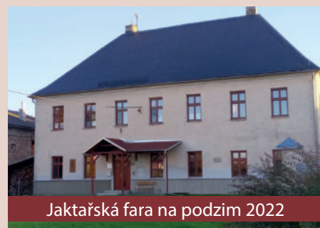
Jaktařská fara na podzim 2022