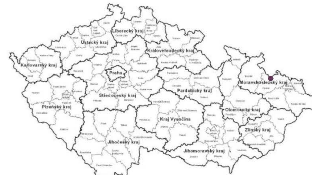
LOKALIZACE NA MAPĚ ČR - SCHÉMA